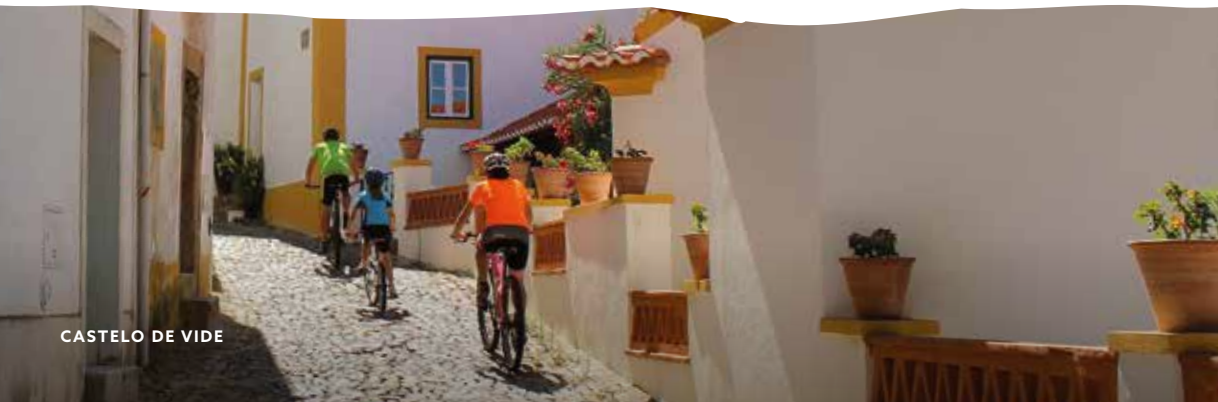
CASTELO DE VIDE

Fietstoerisme staat nog in de kinderschoenen maar daar komt verandering in want de Alentejo heeft talloze autoluwe routes en landwegen, de landschappelijke variatie is groot en in de pittoreske stadjes en dorpen zijn er fietsvriendelijke voorzieningen.