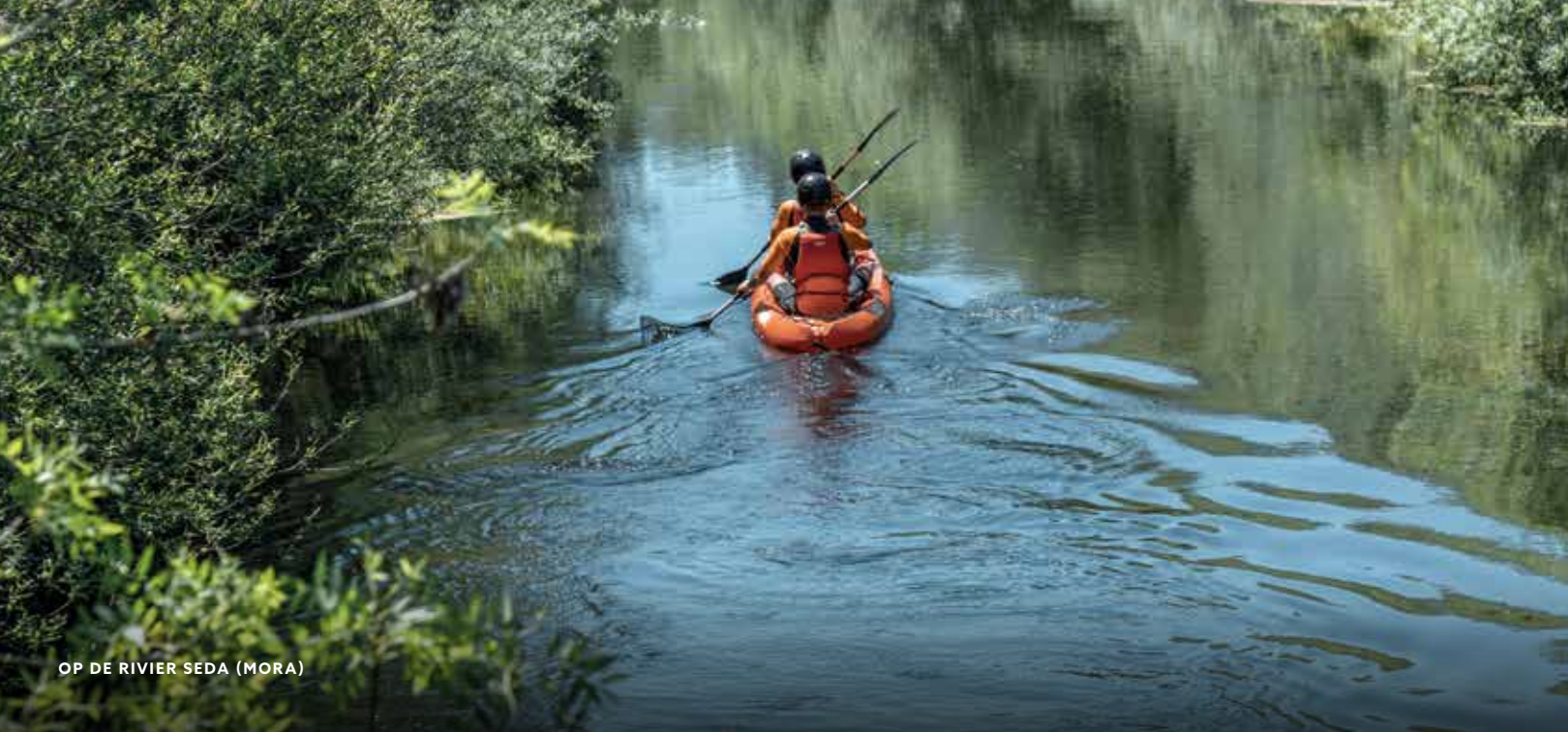
OP DE RIVIER SEDA (MORA)