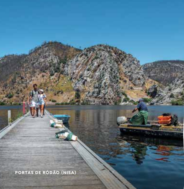
PORTAS DE RÓDÃO (NISA)