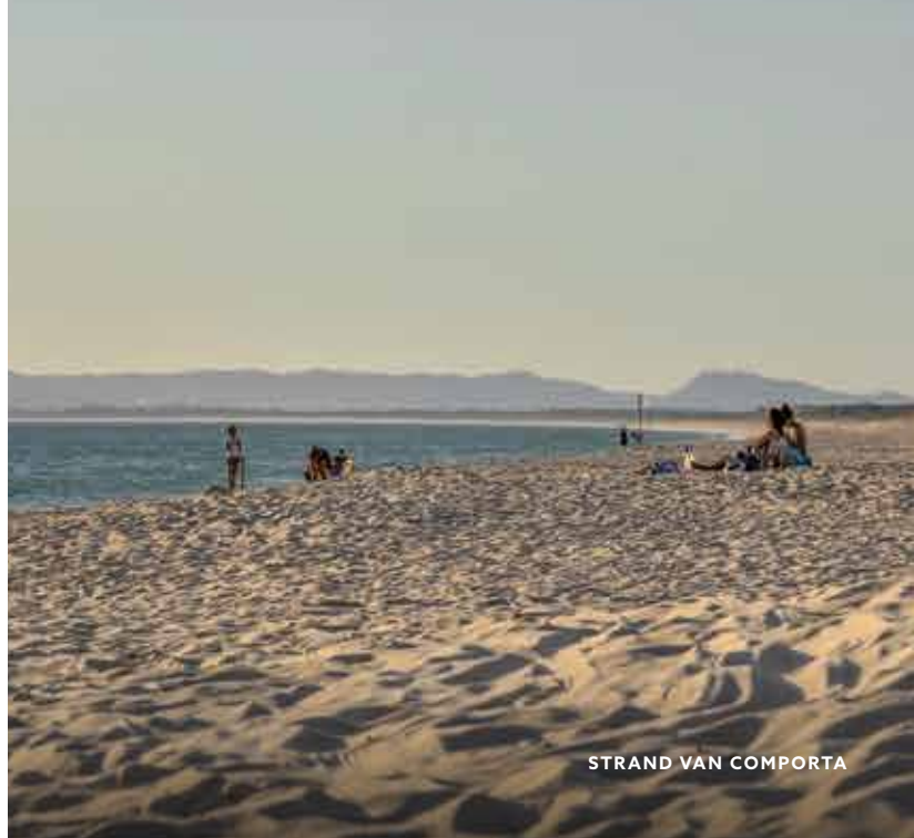
STRAND VAN COMPORTA