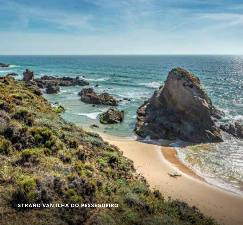
STRAND VAN ILHA DO PESSEGUEIRO