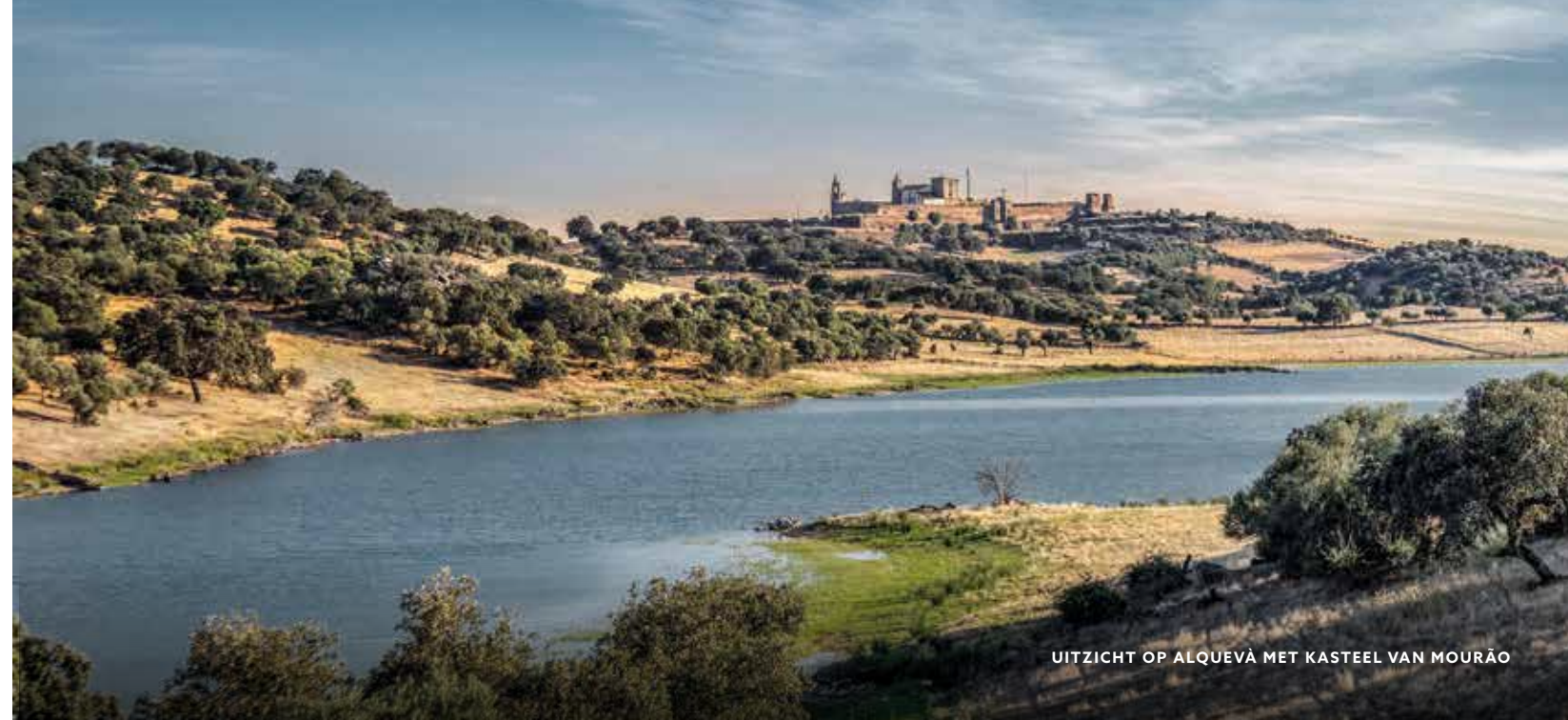
UITZICHT OP ALQUEVÀ MET KASTEEL VAN MOURÃO