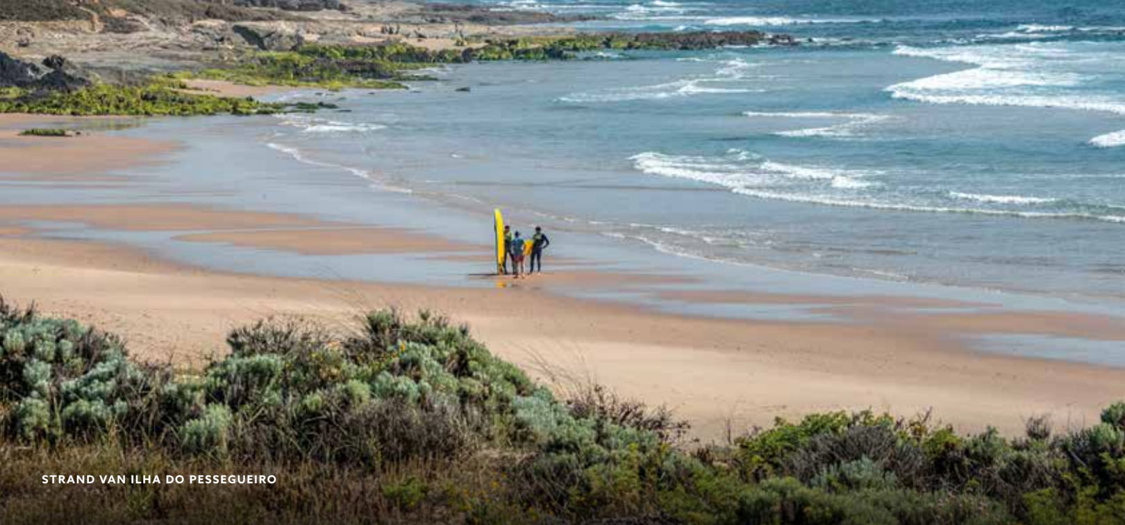
STRAND VAN ILHA DO PESSEGUEIRO