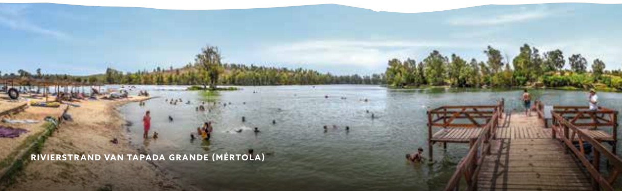
RIVIERSTRAND VAN TAPADA GRANDE (MÉRTOLA)

Met de aanleg van stuwmere in de Alentejo wil men actie ondernemen tegen de waterschaarste en nieuwe perspectieven voor het toerisme creëren. Hier geen hoge golven zoals aan de Atlantische kust maar rustige waters waar kindvriendelijke stranden zijn aangelegd, ideaal om veilig te baden en watersporten te beoefenen. Ook langs de rivieren van de Alentejo en vooral in de meanders zijn er aardige badplaatsen.