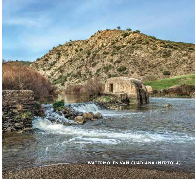
WATERMOLEN VAN GUADIANA (MÉRTOLA)