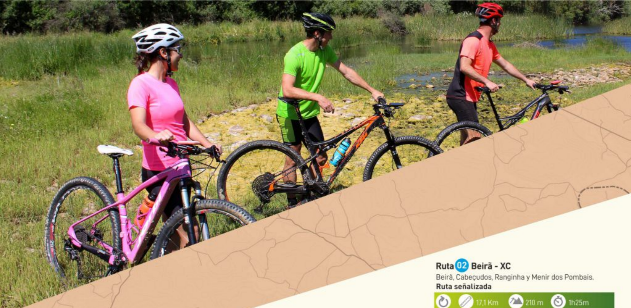
Póvoa e Meadas